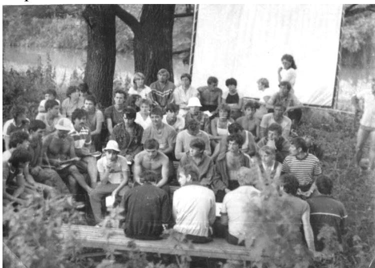
Фото 2. Первый районный и городской туристский слет учащихся. 1985 год.